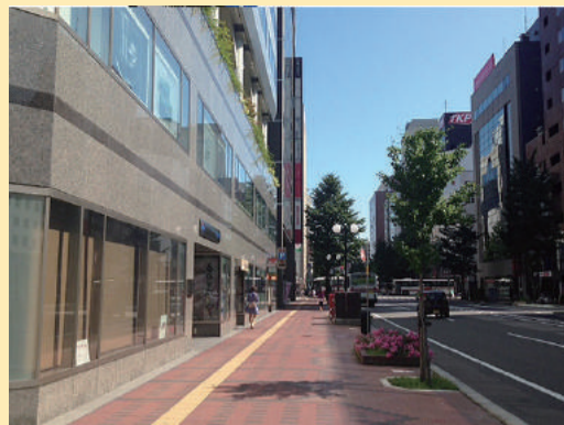
地上② 大同生命ビルを左折します。