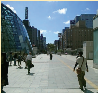
地上① 札幌駅南口を出て 札幌駅前通をお進みください。