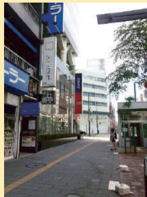
地上③ 左手側にある1Fのドコモショップが目印